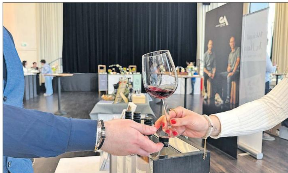
Bei „Schmuck trifft Wein“ konnten Besucher auch die Weine der verschiedenen Wengerter probieren.

Kommenden Sonntag findet der 22. Gmünder Pferdetag in der Innenstadt von Schwäbisch Gmünd statt. Beginn ist um 11 Uhr mit der Prämierung von über 75 Rassepferden. Die Siegerehrung folgt um 14 Uhr. Ergänzt wird das Programm durch vielfältige Vorführungen, darunter eine ungarische Postkutsche, Holzrücken sowie ein historischer Römerwagen. Parallel lädt ein verkaufsoffener Sonntag zum Einkaufen ein.