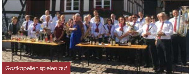
Gastkapellen spielen auf